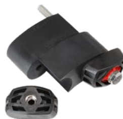
GKD 400 bis GKD 575 & GKD 650