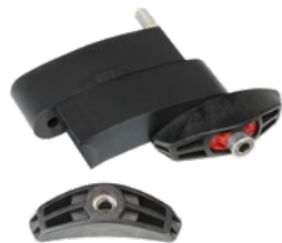
GKD 300 bis GKD 360