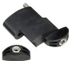
GKD 200 bis GKD 275