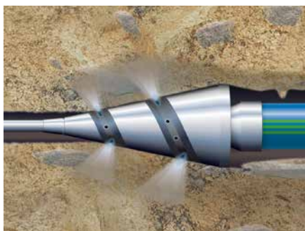
Black-Box-Verlegung wie Spülbohrung, Berstlining, Relining