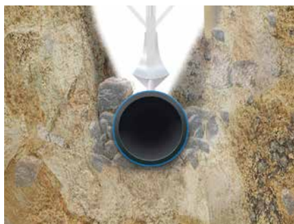
offene Verlegung ohne Sandbett, Pflug-/ Fräsverfahren