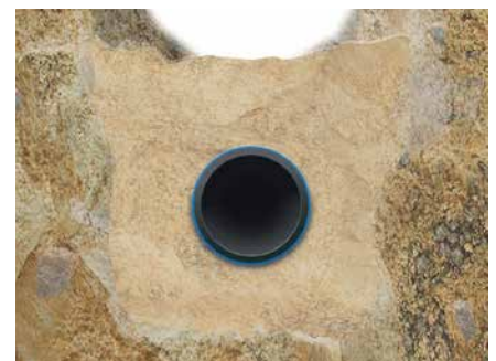
offene Verlegung im Sandbett