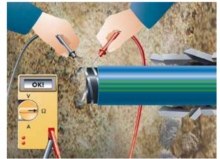
Nachweis auf beschädigungsfreien Einbau nach Verlegung