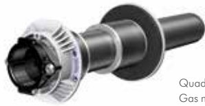
Quadro-Secura® E1/breit Gas mit breiter Außenabdichtung