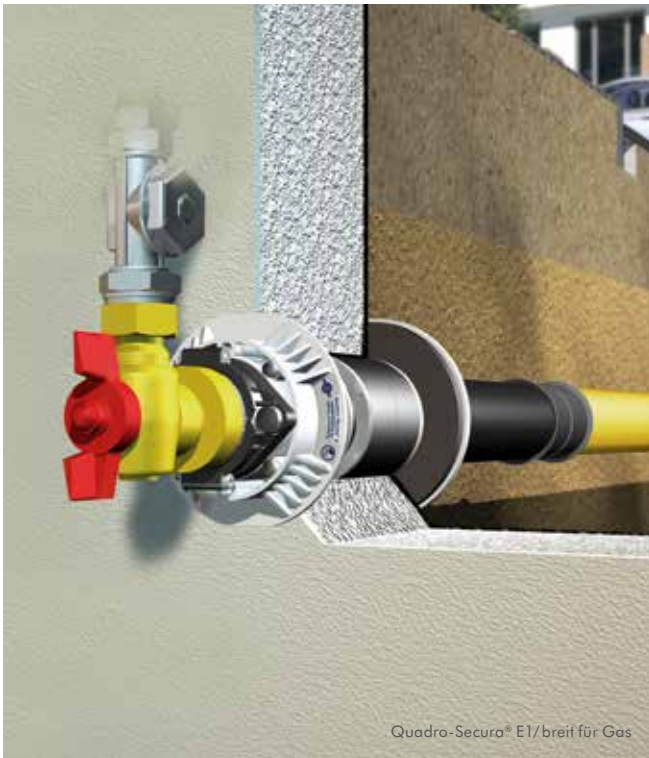
Quadro-Secura® E1/breit für Gas