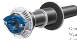
Quadro-Secura® E1/breit Wasser / Strom, Telekom mit breiter Außenabdichtung