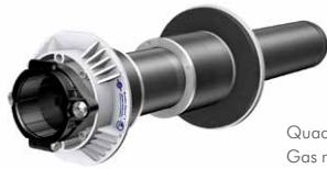
Quadro-Secura® E1/breit Gas mit breiter Außenabdichtung