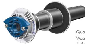
Quadro-Secura® E1/breit Wasser/Strom, Telekom mit breiter Außenabdichtung