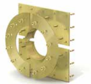
Variante: Curaflex® Futterrohr 7005/T – Geteilte Ausführung, zur Installation bei vorhandener Rohrleitung.